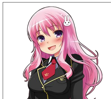
『バカとテストと召喚獣』素材例 (C) 2007 Kenji Inoue・Yui Haga